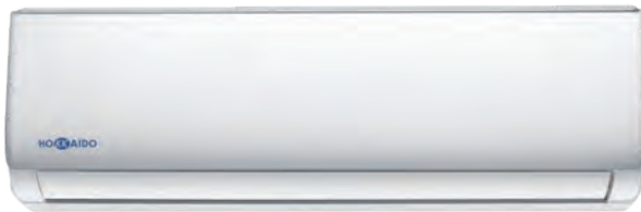
HKETM 260-710 ZAL

Télécommande de série avec capteur de température incorporé (fonction I-Feel)