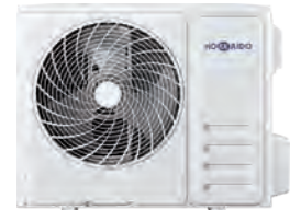
HCNTS 710 ZA