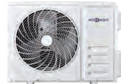
HCNTS 530 ZA