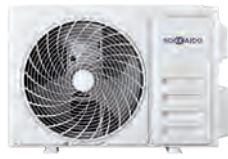
HCNTS 260-350 ZA