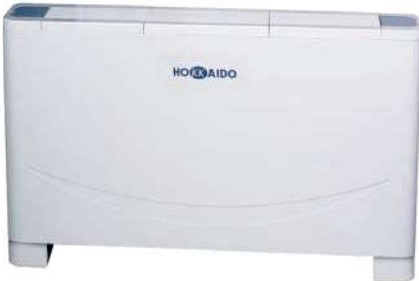
HFLMM 200-900 W-SN