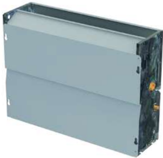
HFYMM 200 W-SN