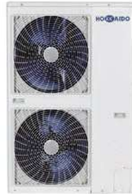
Monophasé 10~12,10 kW HCEMS 1002 - 1202 X Triphasé 14~15,50 kW HCVMS 1402 - 1602 X