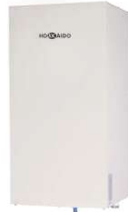
Monophasé HHNMS 4-82 X HHNMS 10-162 X Triphasé HHSMS 12-162 X