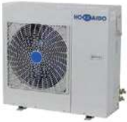
Monophasé 6,10 kW HCEMS 602 X