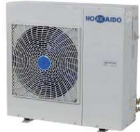
Monophasé 8 kW HCEMS 802 X